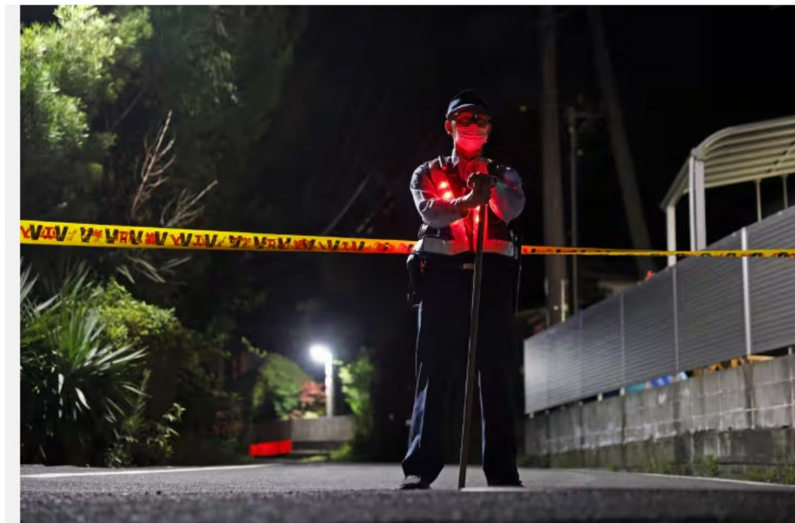
盗殺人事件のあった現場周辺で警戒にあたる警察官＝26日夜、佐賀県伊万里市

福佐賀県伊万里市の母娘強盗殺人事件で、佐賀県警に逮捕されたベトナム人の男（24）は現役の技能実習生だった。技能実習制度をめぐっては、よりよい待遇を求めるなどして実習生の逃亡が頻発。令和5年は約9800人が逃亡し、うちベトナム人は約5500人で半数以上を占めた。同制度は2年後に新たな「育成就労」に変わる。新制度では職場を移ることも可能となるため、就労生が都市部へ集中する懸念も出ている。