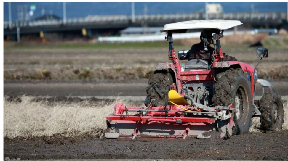
最近過熱する「反外国人感情」。冷静に状況を見つめると、見落としている側面があらわになってきます

2025年7月27日、佐賀県伊万里市に住むベトナム人技能実習生の男が、強盗殺人などの疑いで逮捕された。近くに住む日本人女性を脅し、現金1万1000円を奪ったうえ、ナイフで首などを切りつけて失血死させたとされる。男は黙秘を続けており、詳しい動機は不明だ。事件は周辺地域に大きな衝撃を与え、住民の不安と動揺はいまも収まっていない。悲惨な事件である。いかなる理由があろうと、こうした凶悪犯罪は断じて許されない。筆者もこの男に対し、強い憤りを覚える。被害者の方に心から哀悼の意を表するとともに、犯人には法に基づく厳正な処罰が下されることを切に願う。