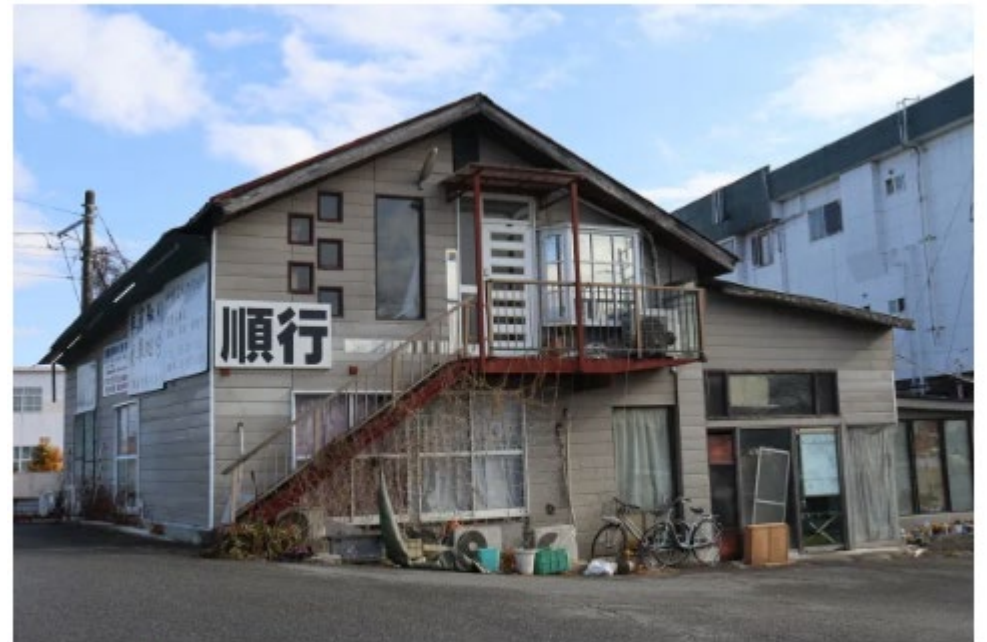
容疑者が経営する会社（12日、南アルプス市で）

不法滞在しているタイ人や就労資格のない中国人らを解体作業員として働かせたとして、山梨県警南アルプス署は12日、中国籍で解体業「順行」（南アルプス市）の社長の男（50）を入管難民法違反（不法就労助長）容疑で逮捕した。同署は不法滞在外国人雇用が常態化していた可能性もあるとみて調べを進めている。発表などによると、容疑者は昨年11月、いずれも不法滞在するなどしていた中国籍の男2人とタイ国籍の男1人の計3人を解体作業員として市内で働かせた疑い。調べに対し、「中国人については自分が面接していないので知らない。タイ人は後で確認しようと思っていた」などと供述している。