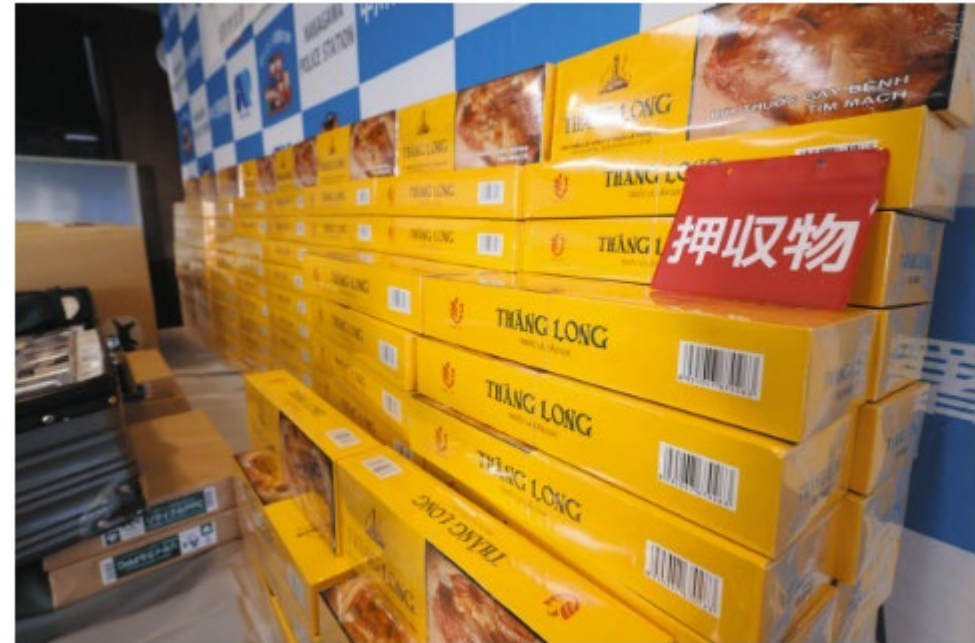
県警がベトナム人グループから押収したたばことみられる商品

特定技能などで日本に在留しながら資格外でたばこを販売したとして、愛知県警は入管難民法違反容疑で、いずれもベトナム国籍で富山県射水市に住む24～35歳の男女計6人を逮捕、4日に送検した。6人はベトナムから密輸したたばこを在日ベトナム人ら延べ9千人に売り、1億円以上を売り上げていたとみられる。逮捕容疑では2月18日～5月2日、6人が住む集合住宅で、無許可で製造たばことみられる商品の販売業を営み、在留資格にない活動をしたとされる。県警は認否を明らかにしていない。